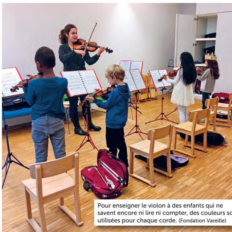
Pour enseigner le violon à des enfants qui ne savent encore ni lire ni compter, des couleurs sont utilisées pour chaque corde. (Fondation Vareille)

A l'instar de Zurich, Martigny et en parallèle de Vernier (GE), Monthey introduit le projet «un violon dans mon école». Quatre classes de 1H-2H du Cinquantoux et du Mabillon seront initiées à cet instrument, dès la rentrée scolaire en août. Le programme comprend trois leçons hebdomadaires d'initiation musicale dans un premier temps avec des professeurs issus des Conservatoires, puis de pratique de l'instrument (par deux, par petits groupes ou par classe) en lieu et place des périodes de musique dans la grille horaire. Chaque enfant se verra attribuer un violon personnel pour la durée du projet (jusqu'au terme de la 4H), instrument qu'il pourra prendre à la maison à partir de la seconde année.