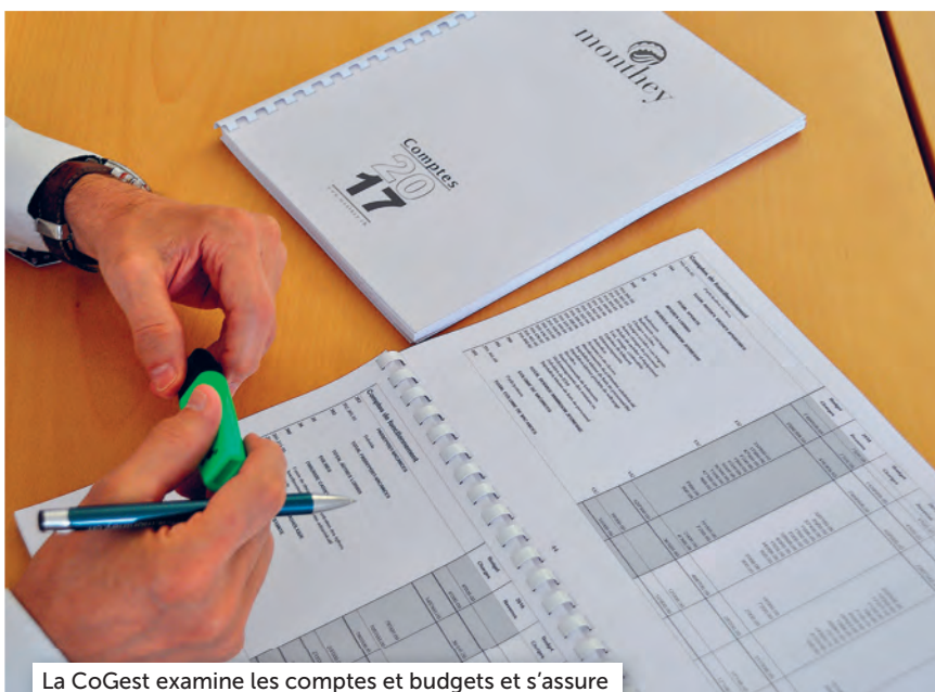
La CoGest examine les comptes et budgets et s'assure de la bonne gestion de la ville. (Ville de Monthey)

En début d'année, nous vous avons parlé du rôle des membres du Bureau du Conseil général, aujourd'hui, nous avons envie de vous faire entrer dans le «secret» des commissions permanentes.