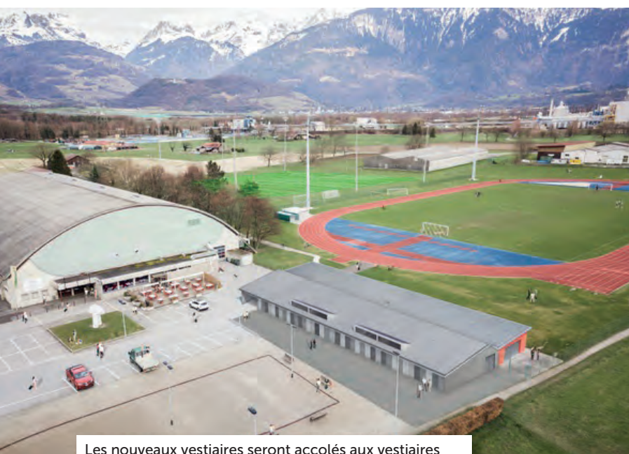
Les nouveaux vestiaires seront accolés aux vestiaires actuels permettant de créer des circulations internes abritées.

Dans le cadre du développement de la zone sportive du Verney, un terrain synthétique et quatre terrains juniors seront aménagés cet été. Pour répondre aux normes, de nouveaux vestiaires seront également construits.