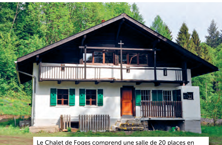
Le Chalet de Foges comprend une salle de 20 places en bas et une autre de 60 places en haut.

Le Chalet de Foges – anciennement appelé Chalet la Moto Verte – vient d’être entièrement rénové. Depuis mi-juin, il fait désormais partie des salles et bâtiments à louer à Monthey.