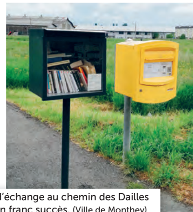
La boîte d'échange au chemin des Dailles connaît un franc succès.

Voilà déjà deux ans que la première boîte montheysanne a vu le jour au chemin de Dailles et le succès est au rendez-vous! Livres, dvds, magazines, ... La boîte voit défiler de nombreux objets. C'est également grâce à ce projet pilote que 7 citoyens ont développé le concept dans leur quartier, en collaboration avec Soluna et les services techniques de la Ville, ce qui a permis la création de ces 4 nouvelles boîtes.